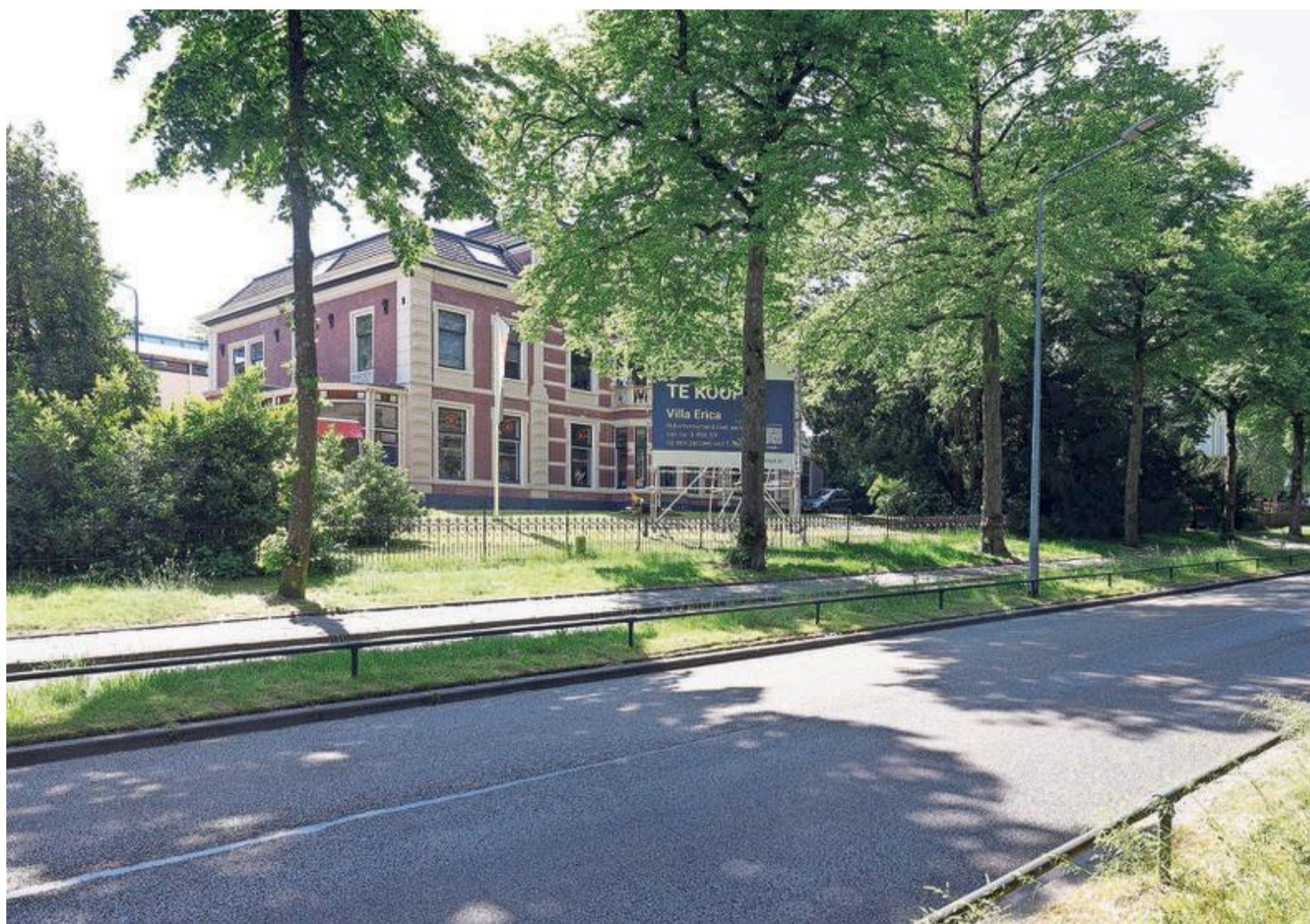
Voorzicht van de Hilversumse bibliotheek.

Overal staan monitoren, bureaus en zijn mensen aan het werk. Wat doet denken aan lang vervlogen tijden zijn de oude foto's aan de wanden. Daar is te zien waar de ruimte eerst voor gebruikt werd. Zo was een van de kamers na de oorlog ingericht als kapsalon voor de Canadezen. Waar toen met de tondeuse gewerkt werd, komen nu de A4'tjes uit de printer.