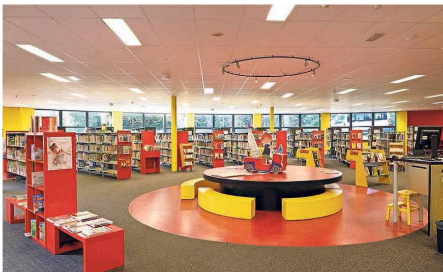
Nu staat de aanbouw nog vol met boeken.

Hij neemt ons mee voor een rondleiding. Te beginnen met het hek, bij de 's-Gravelandseweg, dat is bijzonder. Net als de gevel van Villa Erica, daar waar nu de Kunsttuin en een deel van de backoffice van de bieb zit. Ook het trappenhuis in de oude villa is monumentaal. Daar mag ook niet aangekomen worden. Verder is het pand nu vooral ingericht als kantoorruimte.