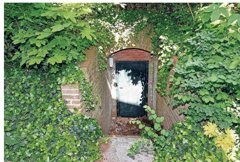
De ietwat verstopte deur naar de schuilkelder.