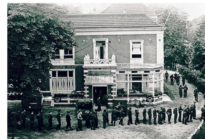
Beeld van net na de oorlog: Canadese soldaten in de rij voor soldij.

Over de verkoopprijs kan hij niets zeggen. „Eerlijk gezegd weet ik het gewoon niet. Het is geen standaard gebouw, het is meer dan bakstenen. Het gaat ook om de locatie en het sentiment. Een schatting? Nee, ook daar waag ik mij niet aan.”